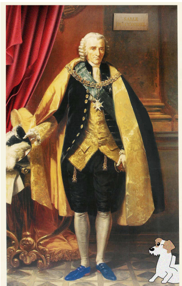
Portrait en pied du maréchal de Richelieu par Auguste Couder (1835)