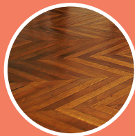
parquet à points-de-Hongrie