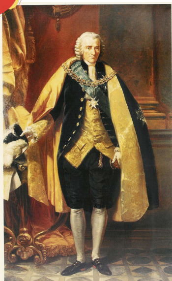
Portrait en pied du maréchal de Richelieu par Auguste Couder (1835)